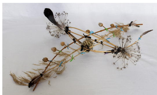
Tooza Theis, Vivamus, Volanti, Ornithochory , 2016

Pour 2019, se tiendra la 4ème édition des Objets graine. Objets-symbole, ils concentrent l'essence du travail des artistes qui ont participé à Cahors Juin Jardins depuis son origine, quels que soient leur discipline et leurs matériaux.