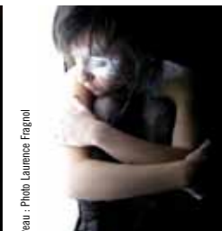
Peau : Photo Laurence Fragnot