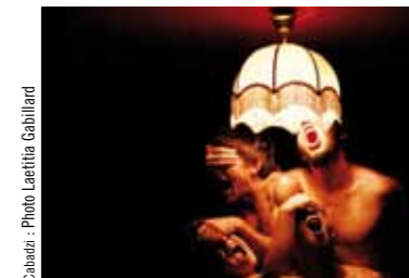
Cadazi : Photo Laetitia Cahillard